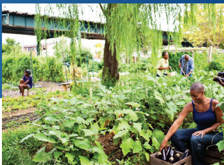
Adoptez la durabilité

Nous assurerons un suivi sécurisé de vos actifs retournés tout au long du processus et vous enverrons un certificat d'effacement des données une fois le processus terminé.