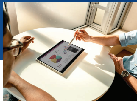
Récupérez de la valeur

Recevez un rapport sur les avantages de la durabilité qui décrit en détail les avantages environnementaux des appareils que nous récupérons.